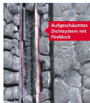
Der Blick in eine freigelegte Ritze der Tür nach dem Brandversuch zeigt, dass diese durch einen kompakten Schaumpfropfen vollständig verschlossen und gegen das Hindurchtreten von Rauch, Flammen sowie Sauerstoff abgedichtet wurde. Die Dichtfunktion der Holzür blieb gewährleistet und die Systemprüfung wurde bestanden.

«Fireblock» ist eine spezielle Mischung aus einem Thermoplast mit einem mineralischen Zusatz, der sich bei Hitze stark ausdehnt. Das extrudierte Verbundmaterial ist allerdings nicht flexibel genug für den Einsatz als Dichtung. Seine Aufgabe ist allein der Feuerschutz. «Fireblock» dehnt sich bei höheren Temperaturen stark aus. Die Volumenzunahme erreicht dabei je nach Materialvariante einen Faktor zwischen 10 bis 50. Dadurch werden die Fugen mit einem nicht brennbaren und zudem gut hitzeisolierenden Material ausgeschäumt und somit regelrecht versiegelt. Diese Abdichtung der Türfugen unterbindet für längere Zeit sowohl die Ausbreitung von Flammen und Rauchgasen als auch die Sauerstoffzufuhr. Zudem sorgt die geschäumte Struktur zusätzlich für einen thermischen Isolationseffekt, und die Wärmeleitfähigkeit des Materials reduziert sich und kann so im Brandfall Bauteile schützen.