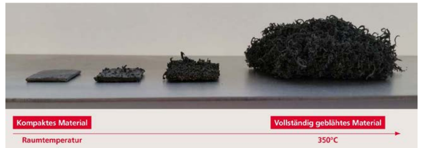
Das Aufschäumen des «Fireblock»-Materials beginnt bei Temperaturen von 180-230 °C und setzt sich bis 350 °C weiter fort.

Bei Temperaturen von 900 °C fallen normale Türsysteme, bestehend aus Türblatt, Zarge und Kunststoffdichtungen, sehr schnell aus, weil sich Tür und Zarge verformen und das Material der Dichtungen schmilzt und verbrennt. Dadurch wird der Türspalt nicht mehr abgedichtet, so dass Flammen, Rauchgase und Sauerstoff zirkulieren können. Das aus Tür, Rahmen und den Dichtungen bestehende Brandschutzsystem würde daher diesen Test nicht bestehen.