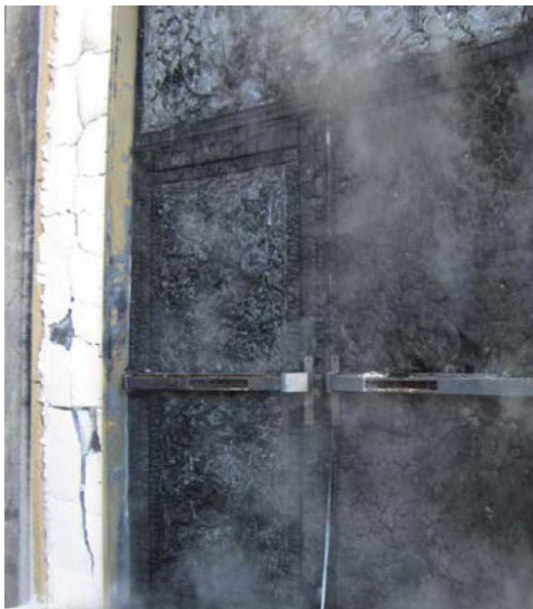
Die Brandprüfung des Türsystems - in diesem Fall eine Holzür mit «Fireblock»-Spezialdichtungen - erfolgt durch Beflammung bei 900 °C.

In Gebäuden mit mehreren Wohneinheiten gelten für Eingangstüren strenge Brandschutzvorschriften. Hierbei spielen auch die Dichtungssysteme eine wichtige Rolle. Sie sollen im Brandfall die Türörter abdichten, um die Ausbreitung von Flammen und Rauchgasen für eine definierte Zeit zu unterbinden. Für solche Aufgabenstellungen wurde mit «Fireblock» ein äusserst wirksames feuerresistentes Material entwickelt, das sich bei Hitzeeinwirkung enorm ausdehnt und die Fugen rund um die Tür abdichtet. Dank hochentwickelter Fertigungsverfahren lässt es sich problemlos in moderne Mehrkomponenten-Türdichtungssysteme integrieren.